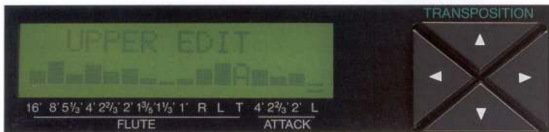
Die Einstellung eigener Orgelklänge ist denkbar einfach. Wählen Sie die gewünschte Fußlage mit den waagerechten Pfeiltasten aus und verändern die Intensität mit den senkrechten Pfeiltasten.

Damit ist es aber auch möglich, den Expander mit anderen MIDI-Geräten zu koppeln, so z. B. mit dem Yamaha MDR-3 oder MDR-2P Music Disk Recorder, womit Sie Ihre Klangprogramme und Registrierungen auf Diskette archivieren können.