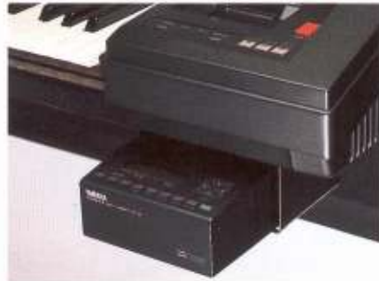
Mit einer als Sonderzubehör erhältlichen speziellen Halterung läßt sich der CVS-10-Expander bequem unter der Tastatur Ihrer Electone anbringen.

Der Einfachheit halber können Sie die Effekte